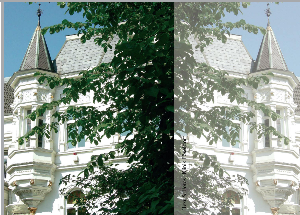
Text & Fotos: Klinik Pöseldorf