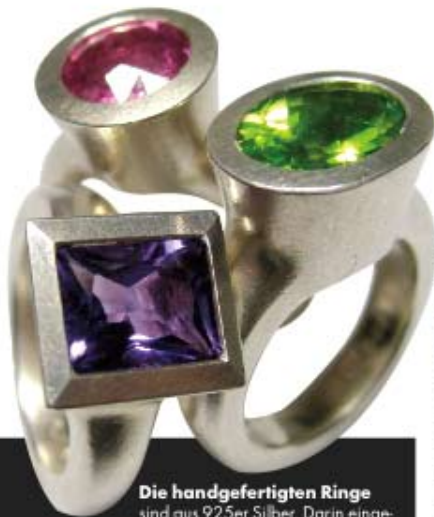
Die handgefertigten Ringe sind aus 925er Silber. Darin eingefasst: ein rosa Turmalin, ein lila Amethyst oder ein grüner Peridot.