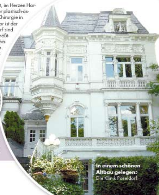
In einem schönen Altbau gelegen: Die Klinik Pöselldorf

„Pöselldorf in Harvestehude ist für mich die schönste Gegend der Stadt. Hier finde ich alles, was ich für ein perfektes Leben brauche: die Alster mit tollen Spazierwegen und wunderbarer Aussicht, gehobene Gastronomie, Einkaufsmöglichkeiten und ein unvergleichliches Ambiente.“